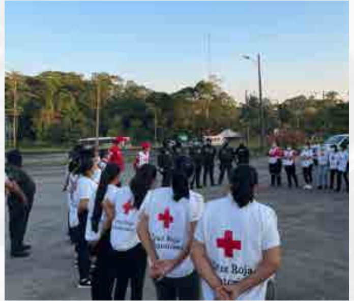
Voluntarios se capacitaron en el taller "Acceso más seguro", filial Sucumbíos.