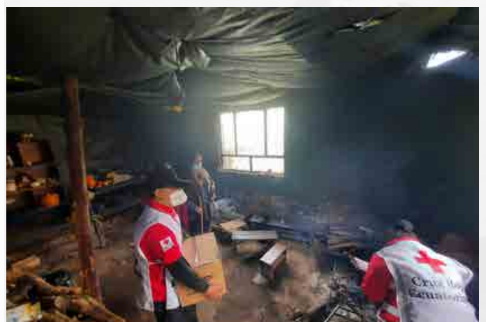
Entrega de asistencia humanitaria a familias en situación de vulnerabilidad, filial Carchi.