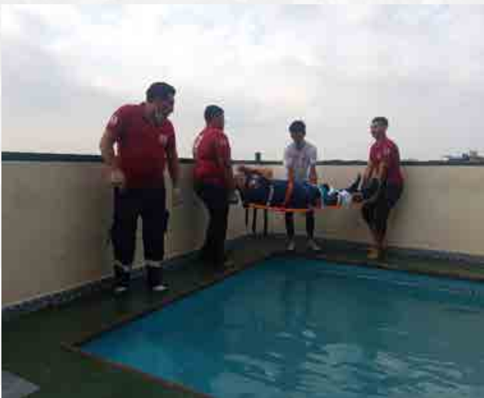
Voluntarios participaron en el taller "Atención Prehospitalaria", filial Santo Domingo de los Tsáchilas.