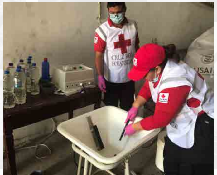
Elaboración de cloro para incentivar el consumo de agua segura y prevenir enfermedades tropicales, filial Los Ríos.