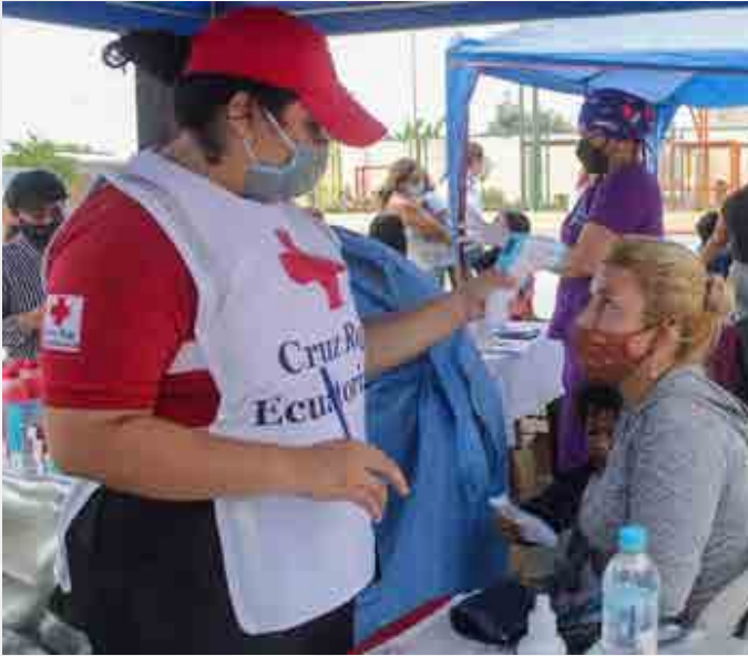
Atención en medicina general y salud mental a población local y en situación de movilidad humana, filial Guayas.