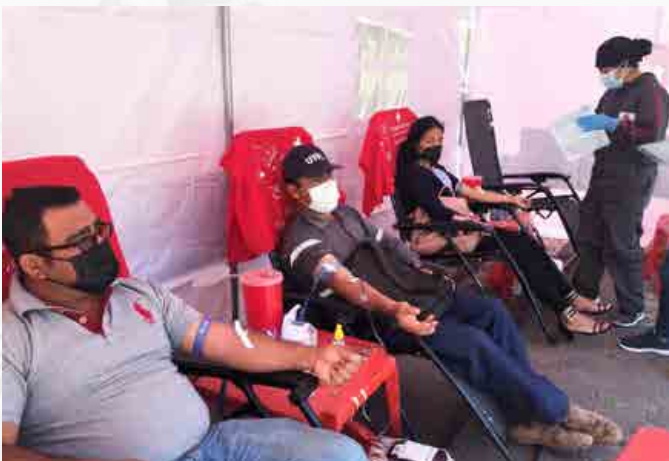
Colecta de donación voluntaria de sangre, filial Loja.